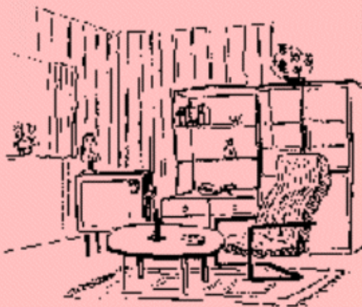
Vardagsrum för förlängda behandlingen

Om Du skulle vara i behov av ett utökat stöd efter den ordinarie behandlingen, kan vi erbjuda en förlängd behandling hos oss. Här bedrivs fortsatt behandlingsarbete med tyngdpunkten lagd på förberedelser inför Ditt nya spelfria liv. Förutom fortsatt arbete med behandlingsprogrammet görs intensiva insatser med att utveckla det sociala beteendet samt den fysiska och psykiska hälsan.